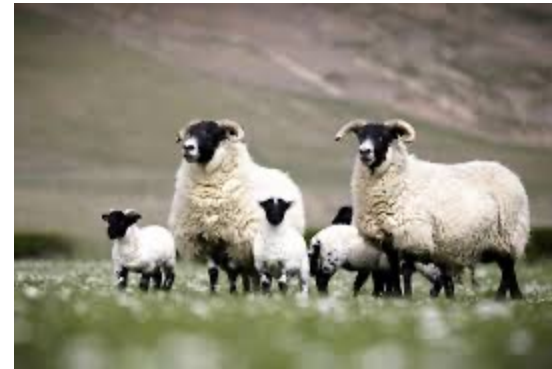
Wyneb Du'r Alban

Diben: Stoc fridio pur. Mae wŷn benywaidd a gwrywaidd diangen, dros ben yn cael eu gwerthu i ffermydd eraill i'w pesgi. Pan fydd y mamogiaid yn hŷn, byddant yn cael eu symud i'r iseldiroedd lle gellir eu bridio â bridiau gwlan hir.