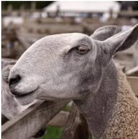
Caerlŷr Wyneb Glas

Nodweddion: Gwneud yn well ar y tir isaf, tir haws na bridiau mynydd. Defaid croesryw yn etifeddu galluoedd mamau da gan berthnasau mynydd.