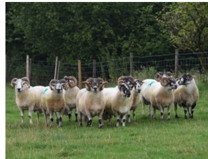
Defaid - Oen